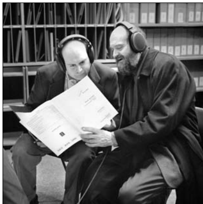
ARVO PÄRT and STEPHEN LAYTON

Il s'agit d'un texte qui, attendait précisément un compositeur de la sensibilité de Pärt pour être mis en musique. Un mélange de sérénité et de tendresse, suivi d'une joie transcendante et scintillante. La même beauté tranquille à laquelle il était parvenu en 1977 dans la